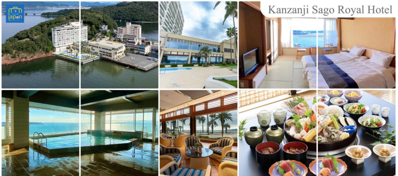
Kanzanji Sago Royal Hotel

จากนั้นให้ท่านได้ผ่อนคลายกับการ แช่น้ำแร่ออนเซ็นธรรมชาติ เชื่อว่าถ้าได้แช่น้ำแร่แล้ว จะทำให้ผิวพรรณสวยงามและช่วยให้ระบบหมุนเวียนโลหิตดีขึ้น