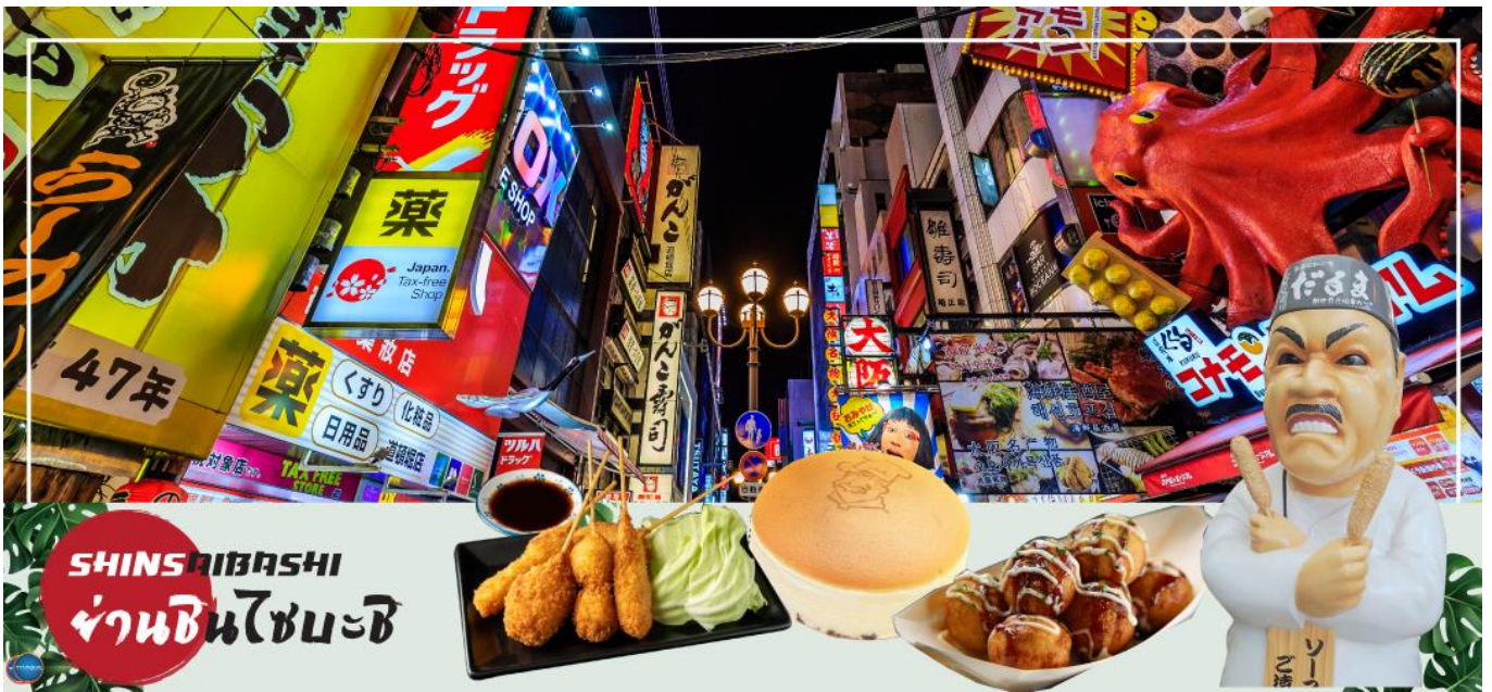
เย็น อิสระรับประทานอาหารเย็นตามอัธยาศัย

จากนั้นอิสระช้อปปิ้ง ย่านชินไซบาชิ (Shinsaibashi) (ใช้ระยะเวลาในการเดินทางประมาณ 30 นาที) บริเวณแหล่งช้อปปิ้งแห่งนี้มีความยาวประมาณ 600 เมตร เต็มไปด้วยร้านค้าปลีก ร้านแฟชั่นร้านเครื่องสำอางค์ ร้านรองเท้า กระเป๋า นาฬิกา ร้านกาแฟ ร้านอาหาร ร้านขนม ร้านเสื้อผ้าสตรีทแบรนด์ทั้งญี่ปุ่นและต่างประเทศ เช่น Zara H&M Beans ABC Mart เป็นต้น เรียกว่ามีทุกอย่างที่ต้องการรวมกันอยู่บริเวณนี้ ใกล้กันท่านสามารถเดินไปยัง ย่านโดทงโบริ (Dotonbori) ย่านบันเทิงยามค่ำ คินดอลอดแนวถนนเลียบบคลองโดทงโบริ จากสะพานโดทงโบริบาชิไปจนถึงสะพานนิปปอนบาชิ ไฮไลท์!!! ใครๆ ก็เซ่ดอิน ถ่ายภาพคู่ ป้ายกูลิโกะแมน หรือ ป้ายโดทงโบริกูลิโกะ (Dotonbori Glico Sign) เป็นป้ายไฟนีออนรูปนักกรีฑากำลังวิ่งอยู่บนลู่วิ่ง ซึ่งถูกติดตั้งมาตั้งแต่ ปี ค.ศ.1935 นอกจากนี้ยังมีอีกหนึ่งสัญลักษณ์สถานที่นัดพบกันหลง นั่นก็คือ ร้านปูคานิดอรากุ (Kani Doraku) ซึ่งมีปูยักษ์ขยับแขนและลูกตาได้อีกด้วย และห้ามพลาดสำหรับ ทาโกยากิ อาหารท้องถิ่นของชาวโอซาก้า ที่มาถึงถิ่นแล้วต้องลอง Original Taste รับรองไม่ผิดหวังแน่นอน